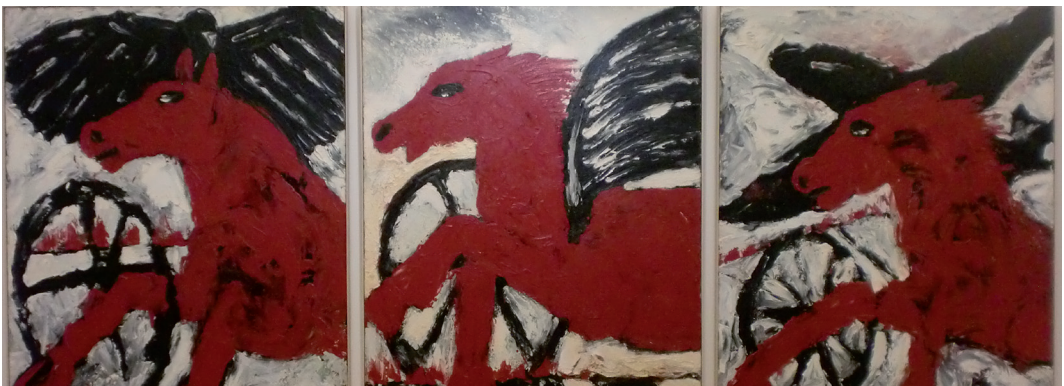
Aarde en vuur (oorlog, bevrijding, vrede)

'Elk landschap is een toestand van de ziel en wie in beide leest, staat versteld hoezeer ze in elk detail op elkaar lijken' (Henri Frédéric Amiel, een Zwitsers wandelaar)