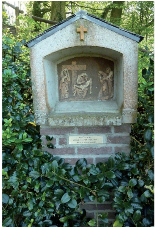
Statie 13: Jezus wordt van het kruis afgenomen