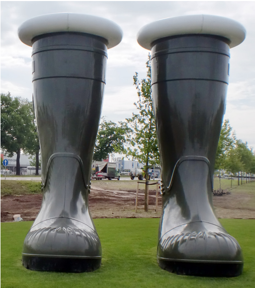
Door laagland gaan

De jeugddienst-commissie wilde een alternatieve kerkdienst beleggen. Na enig vijven en zessen kozen ze voor een survival, een pelgrimage door laagland. In de plaatselijke krant stond de opzet: 'Het is een wandeling door de weilanden. Na vijf kilometer hopen we bij de kerk te komen. We lopen door de weilanden en we vieren een liturgie. Jongeren vinden de kerk niet verkeerd, maar ze willen soms even iets anders en volgens mij beantwoordt de tocht aan die behoefte.' Het had tot gevolg dat het bezoekerstal verdubbelde. Het was twee graden boven nul. Er lag verse sneeuw. Het regende tegelijk. En het was drassig op het land. In de eerste dam gleeed een meisje weg in een modderballet. Ze klaagde niet. Niemand mopperde. De meeste kerkgangers waren die soppige weiden wel gewend.