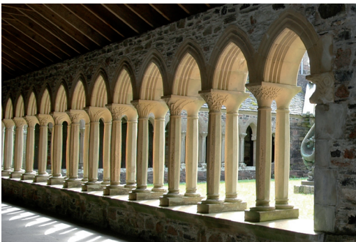
Klooster bij Iona

Niet alleen de geestelijke levensreis, ook de fysieke reis is belangrijk en geeft energie. Van de filosoof Immanuël Kant (1724-1804) is bekend dat hij iedere dag te voet een ronde maakte door zijn woonplaats Koningsberg om zijn zinnen te verzetten. Het bezorgde hem de bijnaam: 'Het horloge van Koningsberg', je kon er de klok op gelijk zetten.