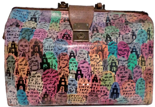
Kijk op pelgrimage via kunstrijroutes

Als voorbeeld werkte hij een rondgang uit door het Rijksmuseum in Amsterdam. Je krijgt een pelgrimsroute aangereikt door het museum. Je komt bijvoorbeeld het schilderij tegen van Nicolaas Pieneman uit 1830. Volgens de catalogus gaat het over de onderwerping van de Javaanse leider Diep Negoro aan luitenant-generaal baron De Kock. De Nederlanders waren met hem in gesprek over vrede. Hem was een vrijgeleide beloofd om te kunnen onderhandelen. Maar de Nederlanders braken hun woord. Ze arresteerden hem tijdens de vredesonderhan-