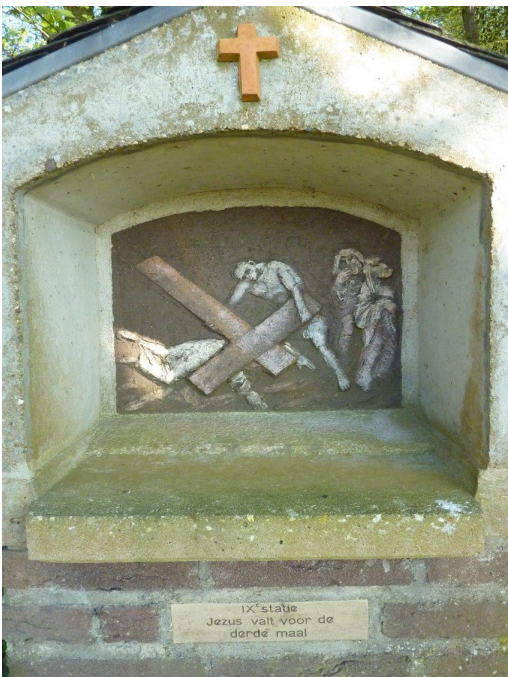
Statie 9: Jezus valt voor de derde maal

Voor de onvermoede wandelaar is het belangrijk om te weten dat deze hier aan bosrand afgebeelde lijdensweg niet naar de ondergang voert, maar een bron is van dankbaarheid, hoop en nieuw leven. De oude Vijlenaren die deze tekens hebben opgericht, indachtig de gruwelijke tijd van oorlog en geweld, wisten dat.