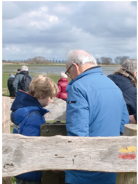
Op pad: jong en oud