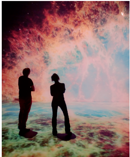
Door de wereld gaan