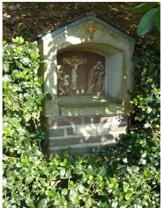
Statie 12: Jezus sterft aan het kruis