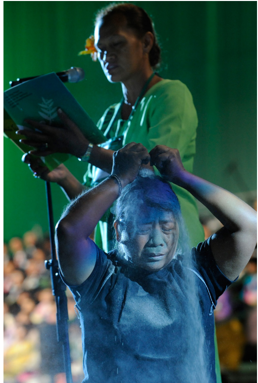
Aarde over je heen, als teken van rouw

Tijdens een kyrie-gebed in Busan werd de rouw om de schade die door mijnbouw werd aangedaan in dramaturgische vorm aanschouwelijk gemaakt (zie foto). Aarde