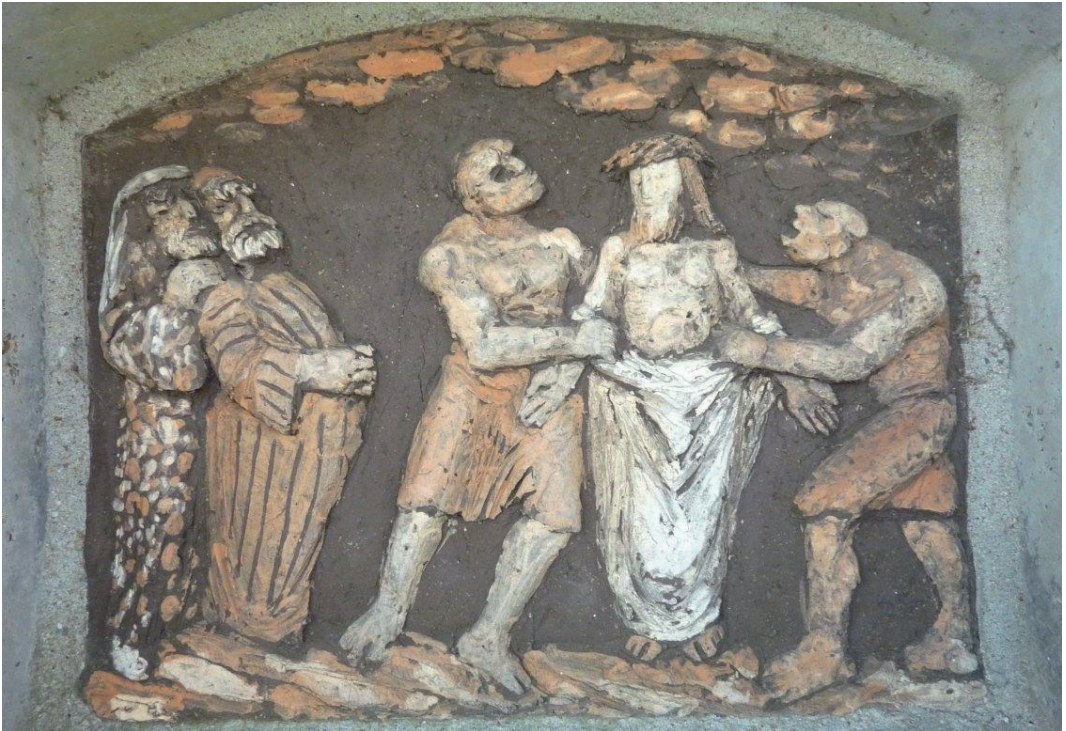
Statie 10: Jezus wordt van zijn klederen beroofd