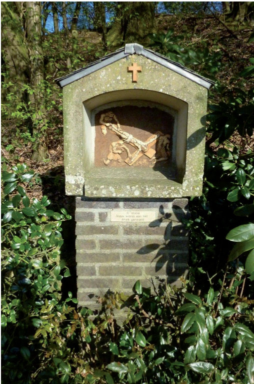
Statie 11: Jezus wordt aan het kruis genageld

In 1966 werd door de kunstenaar Sjef Drummen een nieuw Mariabeeld vervaardigd. Van dezelfde kunstenaar is de Kruisweg van veertien staties die in 1988 aan de toegangsweg naar het Mariamonument werd geplaatst. Ook de Kruisweg kon alleen dankzij de medewerking van de Vijlenaren gerealiseerd worden.