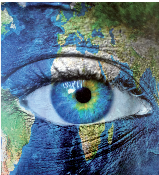
Oog voor de wereld

Een pelgrimage van gerechtigheid en vrede, gaat dat ook over klimaatverandering? Jazeker. Klimaatverandering is een zaak van gerechtigheid. Gerechtigheid als ruimte voor de schepping, die er niet zomaar voor de mens is, maar voor zichzelf. Of liever, voor God, omdat God zag dat dat goed was. Gerechtigheid als ruimte voor toekomstige generaties om een goed leven te hebben. En gerechtigheid als ruimte voor mensen in kwetsbare posities, vooral in het Zuiden van de wereld, die extra onder klimaatverandering lijden. Gerechtigheid dus ook als eerlijke verdeling van de lasten van klimaatverandering en de lusten van het gebruik