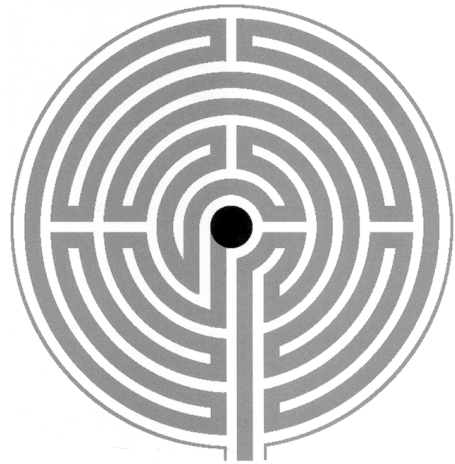
Tekening van het labyrint

In de Oudheid vindt men ze als vloermosaïek, in Scandinavië als aaneen geordende stenen. In vele mythen en sagen is er sprake van labyrinten waar de held doorheen moet om een groot doel te bereiken. In middeleeuwse kathedralen dienden deze 'Chemins à Jérusalem', ter vervanging van een pelgrimstocht naar het Heilige Land, maar ook in kerken op de route naar Santiago worden ze veel aangetroffen. De gelovige legde de weg van het labyrint biddend en op de knieën af. Het vloerlabyrint van de kathedraal van Chartres heeft een doorsnee van twaalf meter, de weg die moet worden afgelegd is ongeveer tweehonderd meter.