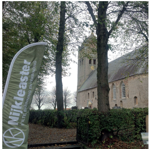
Nijkleaster bij Jorwerd

Bij Nijkleaster wordt tijdens de viering uit de Bijbel gelezen. Nieuwe vertalingen van oude psalmen, gebeden als poëzie, en ruimte om over de tekst na te denken. Het Iona-lied 'Neem mij aan zoals ik ben' zingt men vol overgave. Je mag er zijn zoals je bent, niets meer en niets minder. Eenieder wordt uitgenodigd zichzelf te zijn, kerkelijk of niet-kerkelijk, zoeker of vinder.