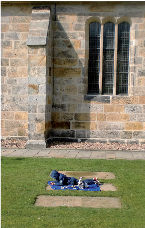
Rust een weinig ...